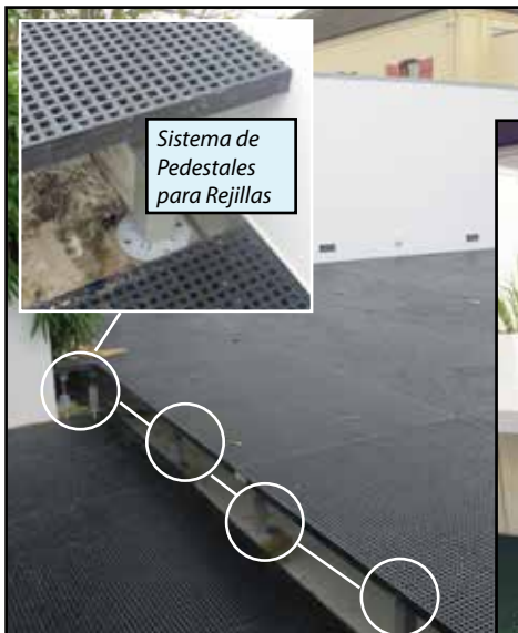
Sistema de Pedestales para Rejillas